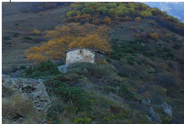
Часовня Рождества Пресвятой Богородицы (она же Иверская) в Куртатинском ущелье