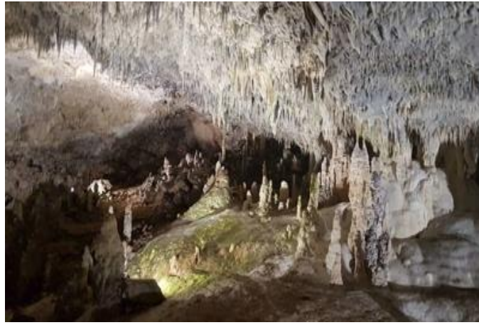
Сталактитовая пещера Нывджинлагат