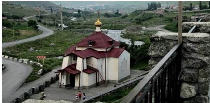
Церковь жен мироносиц