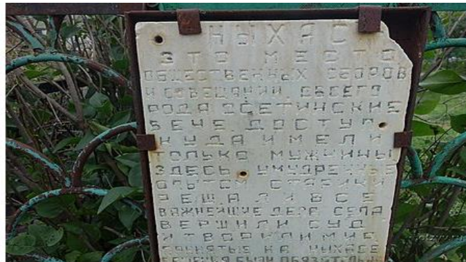
По преданию именно здесь восседали герои нартского эпоса!