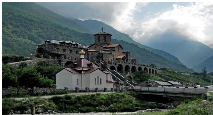
Мужской Успенский монастырь.