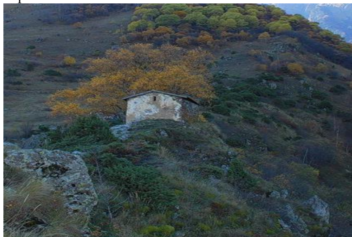
Часовня Рождества Пресвятой Богородицы (она же Иверская) в Куртатинском ущелье