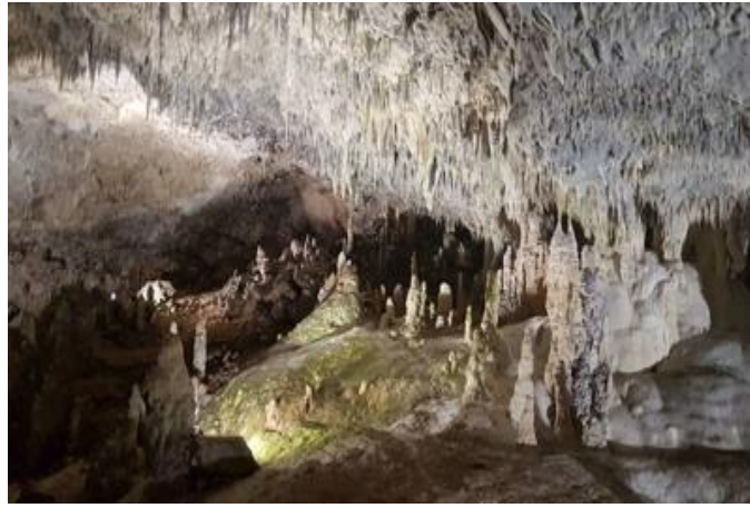
Сталактитовая пещера Нывджинлагат