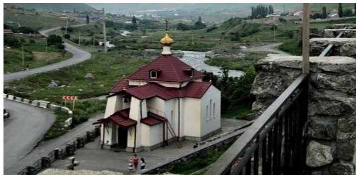
Церковь жен мироносиц