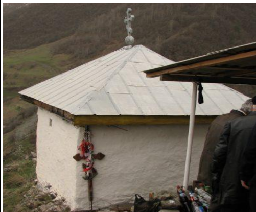
Святылище в с. В.Згид