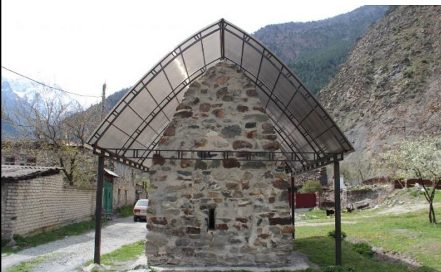
г.Владикавказ – п. Мизур - Ход