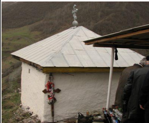
Святылище в с. В.Згид